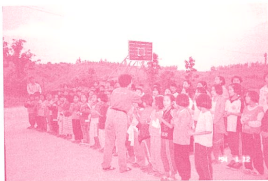
龍傳小學全校學童