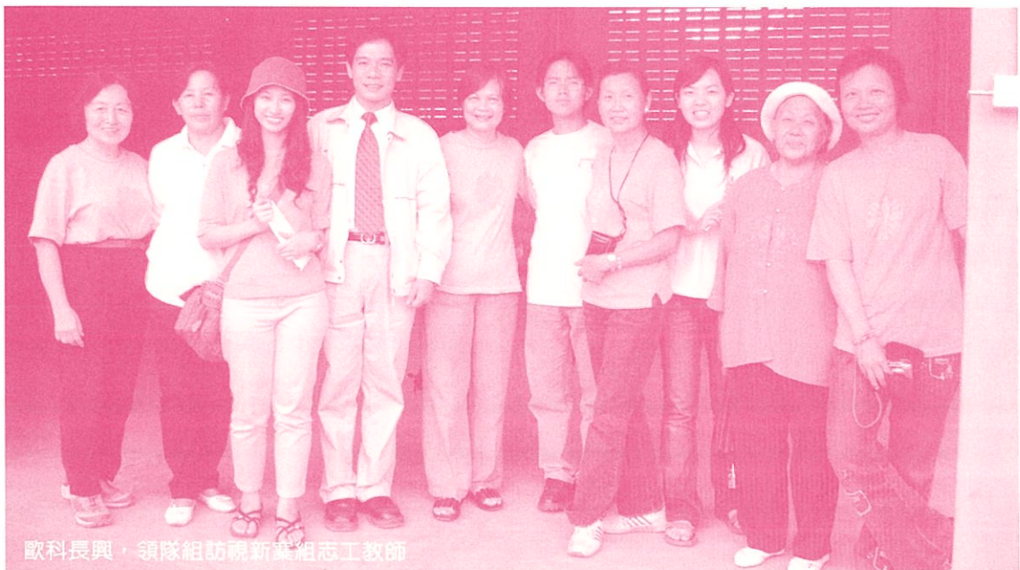
歐科長興，領隊組訪視新襄組志工教師

感受到他們的純樸有禮，我們只是一個先進國家中沒有什麼地位的老師，但在那邊卻頗受禮遇。例如你站著或與人交談，前面有人要經過，他必是低頭彎腰輕身而過，這在許多進步國家中見不到的，有些村民也會不時的送水果，玉米粑粑或青菜給我們。有一天早上上課時，來了一位帥帥的中年華人，他騎著摩托車直抵教室門口，「我剛做好的發糕請大家吃。」原來他是一位受訓老師的哥哥，巧的是那天正是一位志工老師的生日，真是喜出望外。又有一次送果凍來，我正在教舞蹈，他說：『我以前是跳芭蕾舞的，後來因腳受傷後才做廚師，平時我比較習慣用英文交談……』沒想到在這麼落後的村莊，竟有如此人才。他妹妹長的清秀又能幹，竟能捨棄繁華的都市生活，嫁作村婦，由於當地師資缺乏，而英文純熟的她也就成