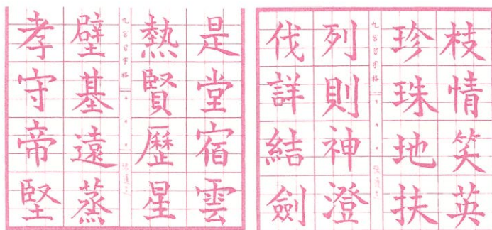
以上是泰北華校學生之作文與書法他們的認真可見

我相信每一位同學都會有一套自己的方法，而且一切方法都會使自己得到智慧，我認為心靈的思想是需要接受別人高尚的思想洗禮，甚至是要一輩子，如果我們讀書是為了一張漂亮的文憑，我認為那是大錯特錯了，讀書是為了自己的夢想，而且那夢想一定是你的最愛、最希望、最想完成的別讓一個懶字偷走了你自己許下的願望，不然你一輩子都會找不到你的幸福，會永遠陷於黑暗的境界，也希望各位同學能在這段時間多多充實，多努力學習，為未來的前程，未來的路很坎坷也很遠，我祝願每一位同學能學到好的成績，過得快快樂樂。✿