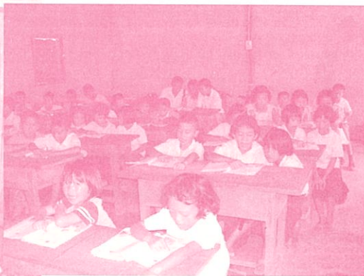
泰北的中華兒女認真學習才有出頭天