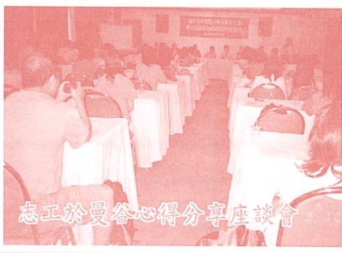
志工於曼谷心得分享座談會