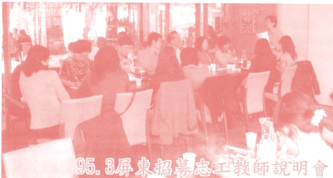
95.3 屏東招募志工教師說明會

來到復華高中已夜暮低垂，首先映入眼簾的正在興建教學大樓，不久蘭校長到來，一直向我們說抱歉，未能接機，主要是為了我們有一個住宿地方，前一刻才督