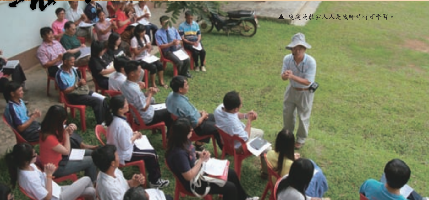
▲ 處處是教室人人是我師時時可學習。