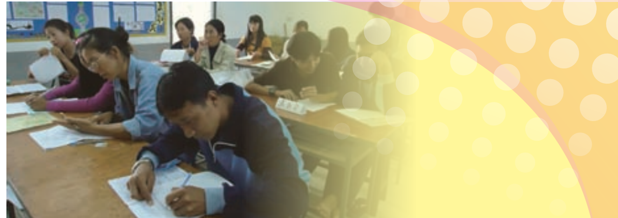
▲ 每一次的研習都很認真學習。

在教學上，余老師今年教導正音課，本校老師在發音上帶有鄉音，朗讀時音調高低分不清，這些都得到老師的指導而獲