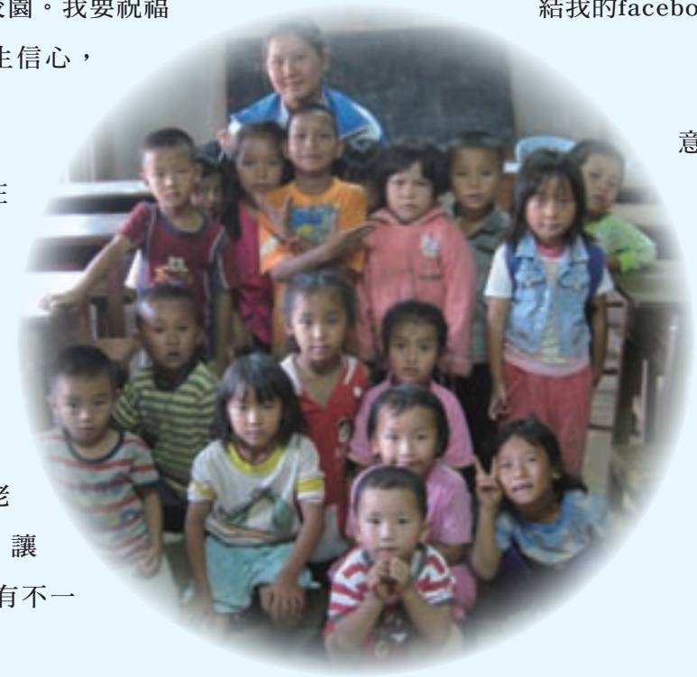
▲ 明愛會從小二認養學童已畢業回校服務。