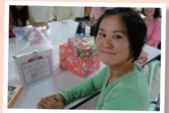
▲認真學習，收穫滿滿。

部留給當地師生，相擁難捨情景更不在話下。明愛會的志工老師就是不一樣。我要再次向參加今年（99）泰北文教服務團的志工老師致敬。您們真的不簡單！✿