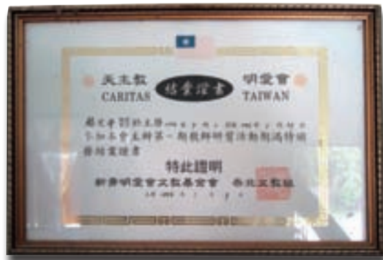
▲ 老師將12年前參加明愛會師資培訓的結業證書鑲上框掛在牆上可見其重視。

要自己出錢出力，如果沒有犧牲奉獻的愛心是不可能一而再地來好幾次。您們的愛心真偉大，在此深深感謝明愛會及各位志工老師對泰北華校的關懷，也因著各位志工老師苦口婆心的教導，使我在教學上不斷地有所長進。