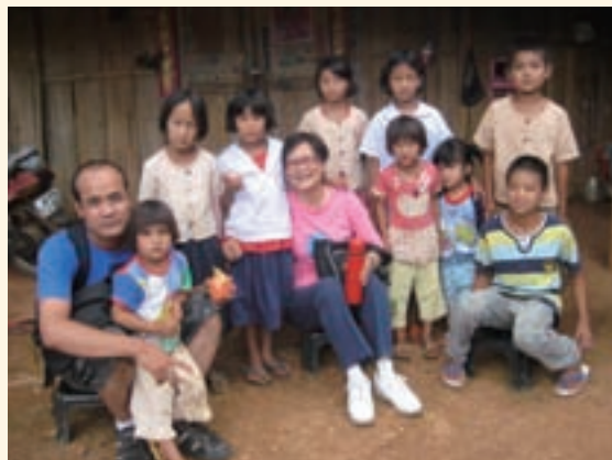
▲ 訪視受惠家庭勾起許多求學往事。

了（2010）。當然來自泰北的我，一路走來，在明愛會的眷顧下，使我找到了做人的尊嚴，順利的大學畢業，過著正常人的生活。