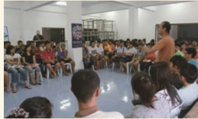
▲ 與青少年分享學習心歷路程鼓勵同學永不放棄。

經這一次的分享活動，隨著張老師翻山越嶺，走遍了泰北大村小寨，看到了每個村子的中文學校，除了回南音村慈光小學、熱水塘村一新中學、滿堂村建華高中、回海村回海小學和正在建設的滿星疊村大同高中有整體的規劃外，其他的學校均是社會慈善團體有捐錢時就蓋一小間，所以學校蓋得很零亂，缺少整體規劃，但他們的存在，卻表現了村民無比的信心與毅力！